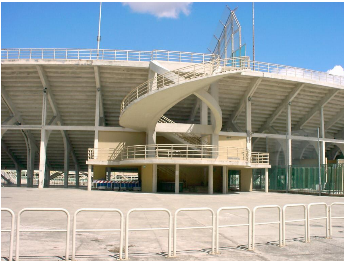
Le Stadio Artemio Franchi à Florence, Italie