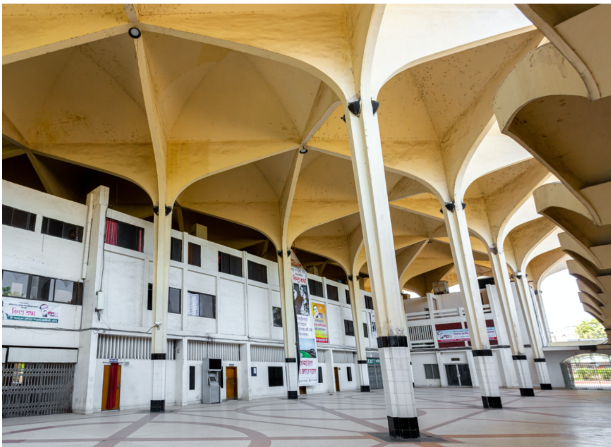
La gare Kamalapur à Dhaka, Bangladesh