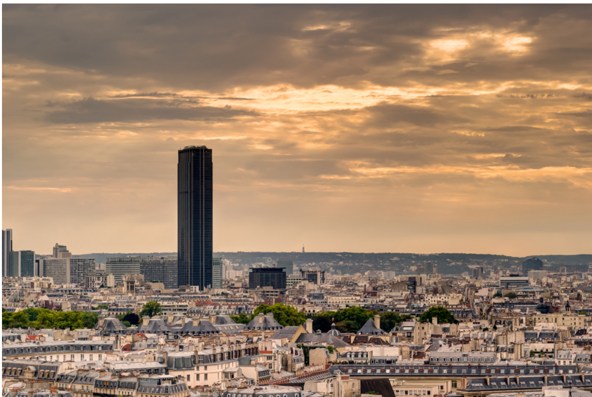
Le Tour Maine-Montparnasse à Paris, France, siège social du Secrétariat UIA