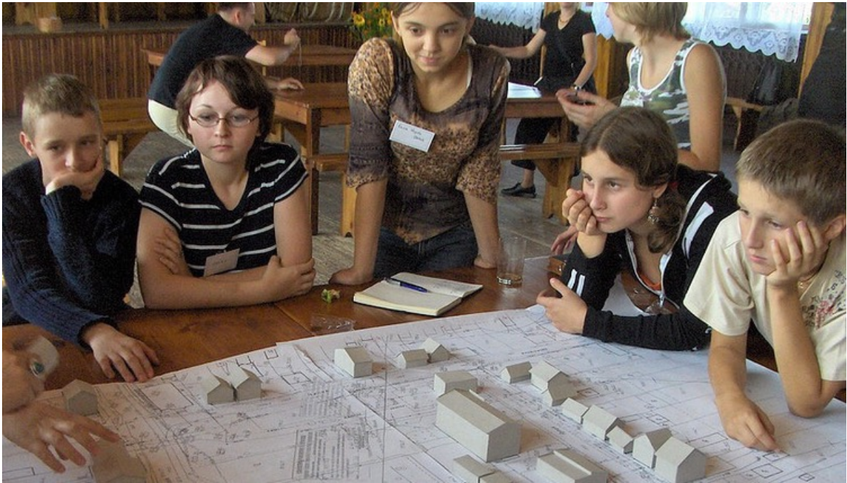
Atelier Architecture pour Enfants en Pologne